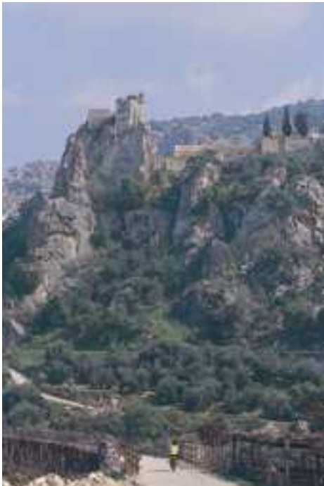
Fig. 5. Las Vías Verdes nos adentran en las áreas rurales, siendo una vía de acceso sostenible a nuestro patrimonio monumental y natural.

Cabe destacar que, desde 2002, el Mapa de Carreteras que edita el Ministerio de Fomento (120.000 ejemplares/año) constituye otro de los principales vehículos divulgativos de las Vías Verdes españolas, a las cuales incluye en su cartografía al mismo nivel de representación gráfica que los viales motorizados, si bien indicando con pictogramas los usuarios a los que están destinados (caminantes, ciclistas, jinetes). Este hecho refleja la importancia que las Vías Verdes están alcanzando en su calidad de infraestructuras de transporte sostenible.