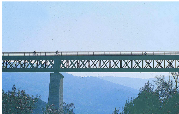
Fig. 2. La Vía Verde del Aceite discurre a lo largo de 112 km por las provincias de Jaén y Córdoba.

El Programa Vías Verdes, en síntesis, tiene por objetivo la reutilización de trazados ferroviarios en desuso como itinerarios no motorizados, que conecten las poblaciones, los espacios naturales y los puntos de interés histórico-artístico, acercando a ellos de forma sostenible al ciudadano. Las extraordinarias ventajas que ofrecen las Vías Verdes por su original uso ferroviario, las convierten en los ejes vertebradores de redes de transporte no motorizado que se pueden configurar mediante la utilización de viales de conexión entre ellas (vías pecuarias, caminos tradicionales, etc.).