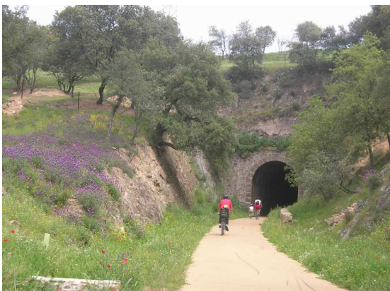
Fig. 3. Vía Verde en el corazón del Parque Natural de la Sierra Norte de Sevilla.

Esta cooperación a nivel institucional se debe complementar con la máxima implicación ciudadana , de modo que la Vía Verde se convierta en un proyecto de la comunidad, en un espacio en el que los ciudadanos de todas las edades pueden contribuir a su pleno y óptimo desarrollo.